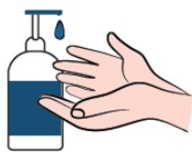
ÁLCOOL EM GEL