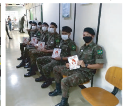
Hemocentro atende de segunda a sexta-feira, das 7h às 13h