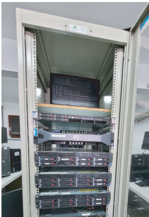
A previsão de suspensão é de aproximadamente 16 horas

e acesse às diretrizes / escalas do Plano de Contingência HCFAMEMA do próximo sábado (8)