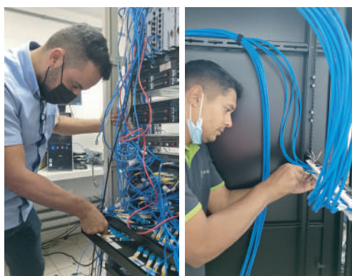
Equipes já trabalham na realocação do DataCenter