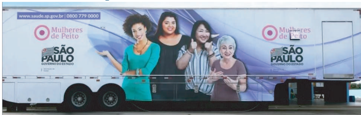
A estrutura de atendimento será posicionada no Hemocentro HCFAMEMA

Como parte das ações da campanha "Outubro Rosa", o HCFAMEMA recebe entre os dias 18 e 29 de outubro o Programa Mulheres de Peito – iniciativa do Governo do Estado que realiza exames de mamografia gratuitos. Trata-se de uma carreta equipada que facilita o acesso das mulheres ao exame preventivo do câncer de mama, tipo de câncer mais comum entre as mulheres no Brasil e no mundo.