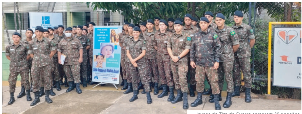
Jovens do Tiro de Guerra somaram 80 doações