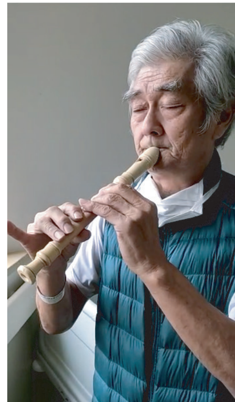
O gosto pelo instrumento surgiu há 46 anos

“ Nas filas do supermercado, na padaria e agora no hospital. Quando a minha esposa veio me visitar, me trouxe a flauta, que eu havia deixado em casa pois não sabia que ficaria internado ”