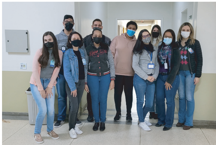
DEFCONT - Departamento Econômico, Financeiro e Contábil

As mudanças das salas começaram ainda em junho e se estenderam até a última semana, momento em que o antigo prédio administrativo foi totalmente evacuado e passou a ser demolido.