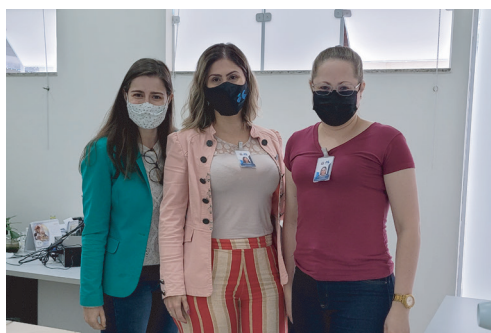
DGP - Departamento de Gestão de Pessoas