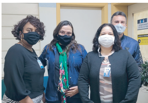
DGP - Departamento de Gestão de Pessoas