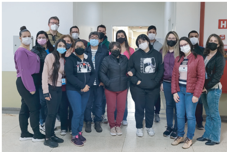
DEFCONT - Departamento Econômico, Financeiro e Contábil

VEJA NA ARTE ABAIXO OS LOCAIS DE TENDIMENTO DE CADA SETOR: