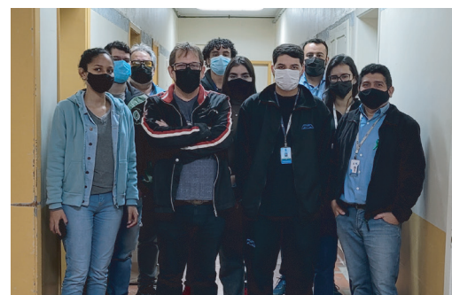
DTI - Departamento de Tecnologia da Informação